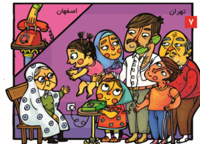
همه اعضا، خانواده آدرس و تلفن یکی از آشنایان در شهر دیگر را می‌دانند.