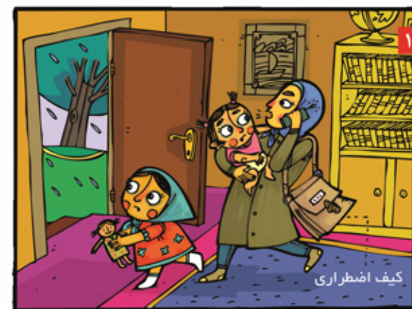
هنگام تخلیه، کیف اضطراری را بر میداریم و خروجمان را به همسایگان و آشنایان اطلاع می‌دهیم.